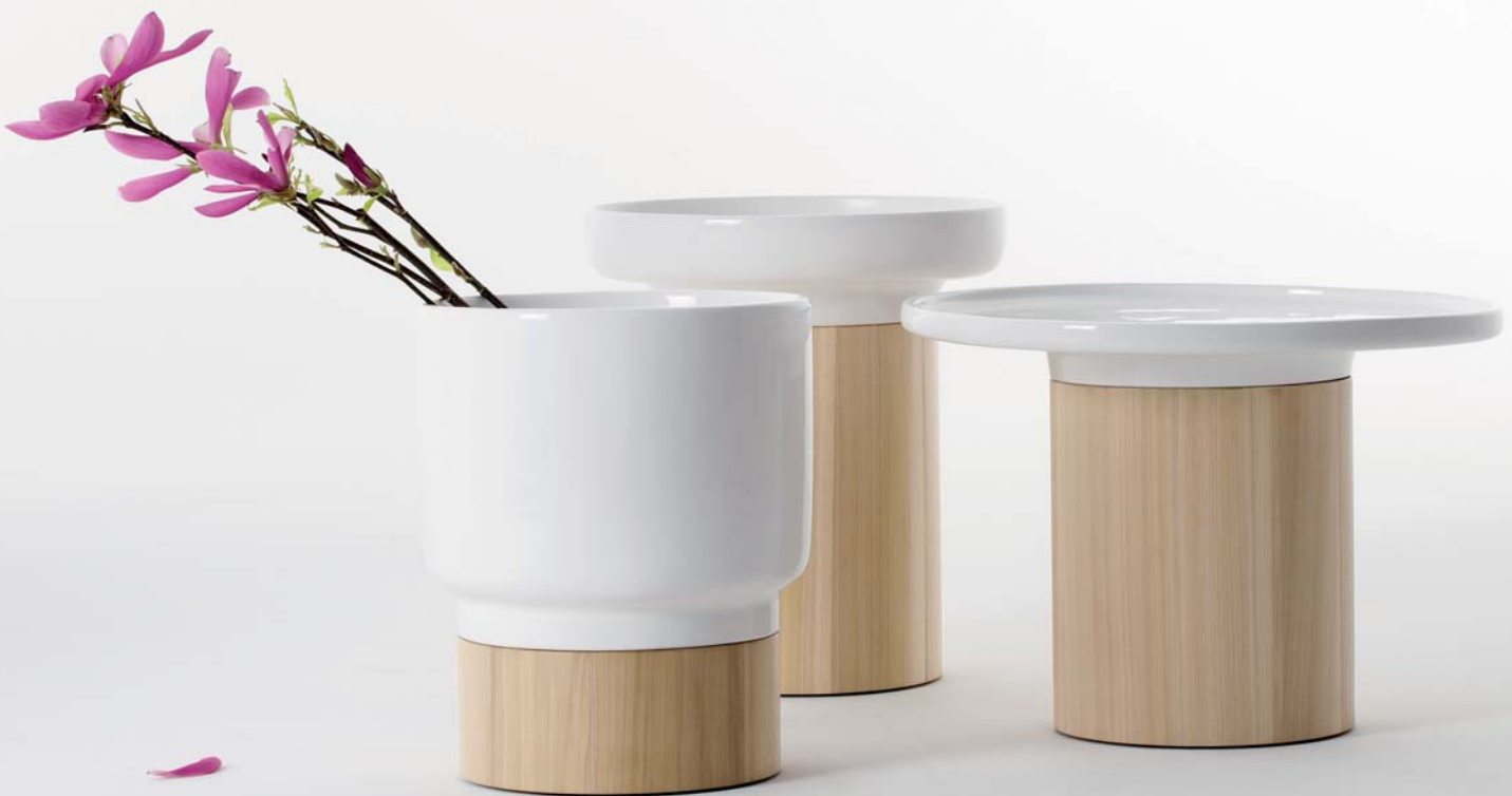
APU, Keramik mit Holzsockel